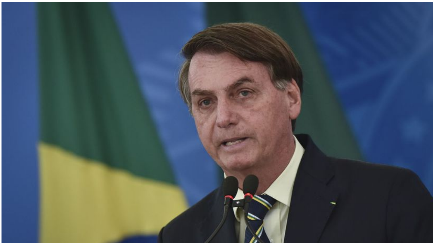
Brazílsky prezident Jair Bolsonaro.