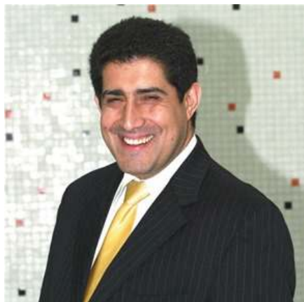
Patricio Navia Político chileno.

Precisamente porque Chile ha experimentado crecimiento y el país está en mejores condiciones que nunca antes en su historia, muchos chilenos sienten que ellos han sido excluidos de los beneficios del progreso y del desarrollo. En Chile hay dinero, el país ha generado riqueza, pero sigue habiendo altos niveles de desigualdad. Los chilenos no quieren cambiar la hoja de ruta, no quieren alterar la dirección de crecimiento y desarrollo en la que avanza el país. Pero sí quieren ser partícipes y beneficiarios de ese crecimiento. Saben que hay una gallina que pone huevos de oro, pero quieren también recibir algunos de esos huevos de oro y no solo ver como otros se quedan con todos los huevos.