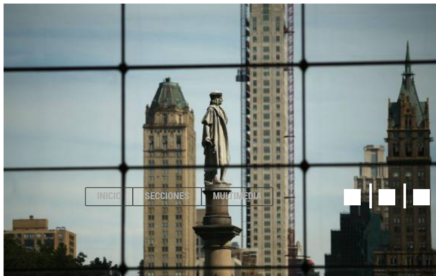
La estatua de Colón se encuentra en un punto neurálgico de la ciudad, pegado al Central Park y a la sede de CNN.

ACTIVIDADES ILEGALES DONALD TRUMP ESTADOS UNIDOS INTERNACIONAL NORTEAMÉRICA NUEVA YORK POLÍTICA INTERNACIONAL PRESIDENTE DE ESTADOS UNIDOS RACISMO